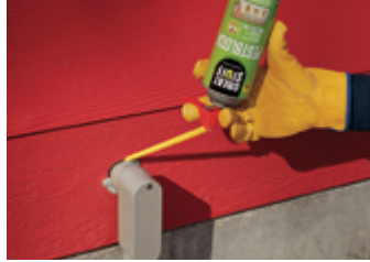
Lignes de câbles électriques