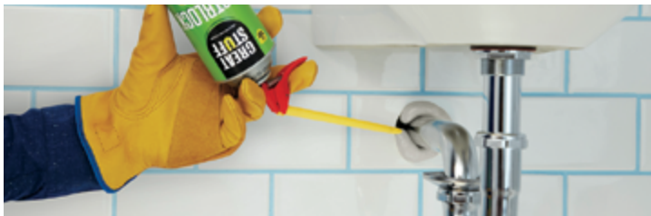
Traversées de plomberie