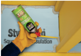
Solives de rive