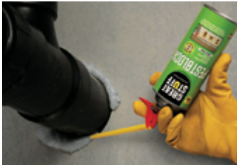
Traversées de tuyaux en PVC