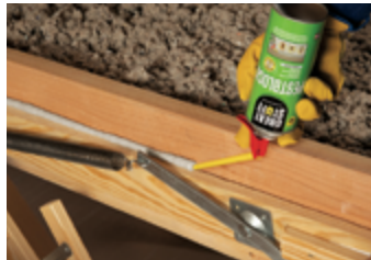
Marco de la puerta de acceso al ático