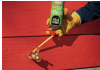
Penetración del grifo del agua