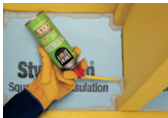
Viguetas del borde