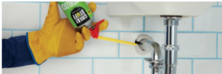
Penetración de plomerías