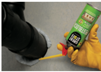
Penetración de tubos de PVC